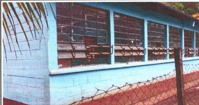
Foto 2: Se observa que las ventanarias no cuenta con balcones en el modulo 1