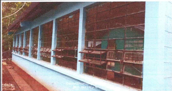
Foto1: Se observa el area de ventanaria en mal estado del modulo 1