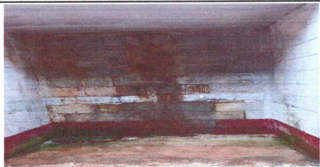
Foto 3: Se observa el desprendimiento de pintura en las paredes en el modulo 1