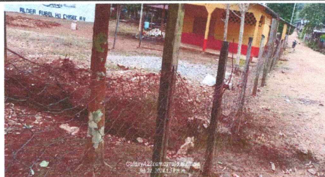
Foto 4: Se observa el deterioro del muro perimetral del predio del establecimiento